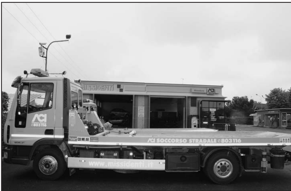
ACI Soccorso stradale 24 ore su 24 - Auto sostitutiva

ELETTRAUTO - OFFICINA MECCANICA - GOMMISTA AUTOLAVAGGIO COMPLETO - SELF SERVICE ACI SOCCORSO STRADALE 24 ORE SU 24 NUOVO CENTRO REVISIONI - SENZA PRENOTAZIONE