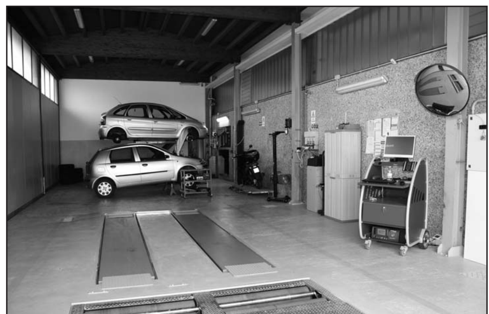
Nuovo centro revisioni, tutti i giorni senza prenotazione - Moto - Quad - Auto - Furgoni fino 35 q.

030.962501 IL TELEFONO AL TUO SERVIZIO 24 ORE SU 24