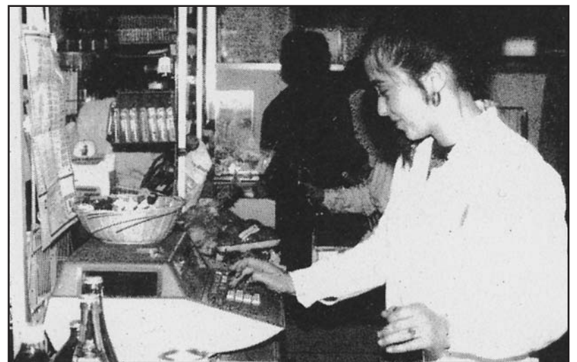
L'uso del registratore di cassa in un noto supermercato.

Sembra che il tempo si sia fermato, invece sono passati ben trent'anni e sembra che le motivazioni siano ancora le stesse.