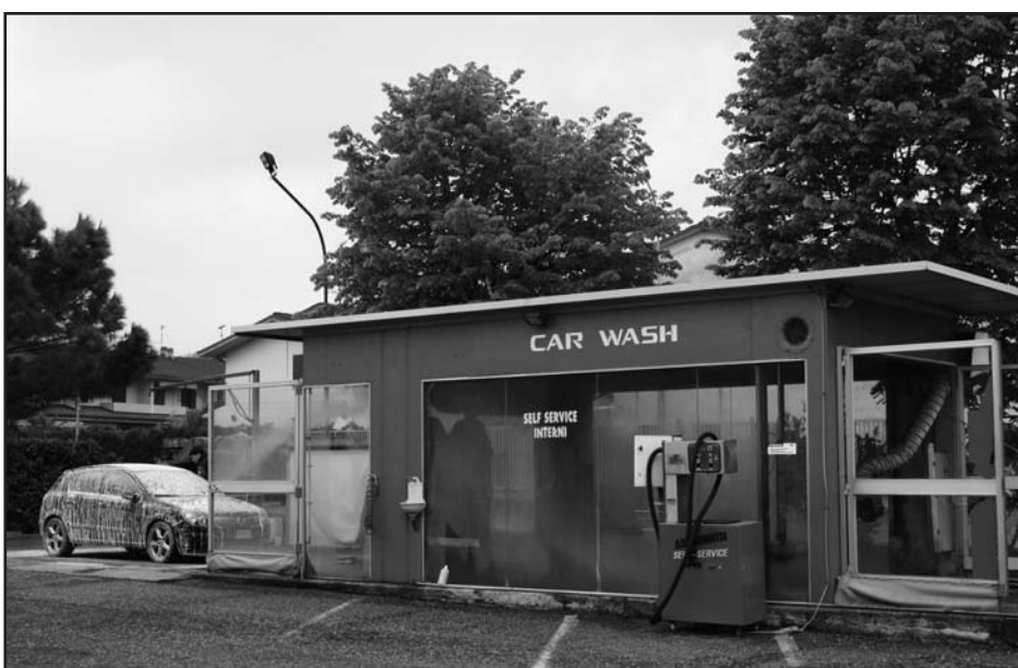
Autolavaggio completo, con self service interno autovettura Ogni 10 lavaggi 1 in omaggio