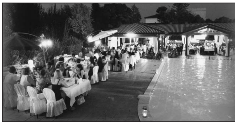
Cene d'estate a bordo piscina.

Venerdì 15 GIUGNO, dalle ore 20,30, l'ormai classica FESTA D'ESTATE; gran buffet