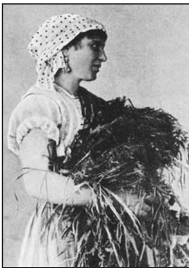
Una nota immagine della spigolatrice, che accompagnava sui testi scolastici la famosa poesia di Mercantini.

prima volta la trebbiatrice rumoreggiava nel cortile della cascina e "mangiava" i covoni separando i chicchi dalla paglia, il taglio del frumento era ancora manuale.