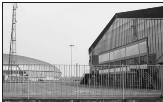
Palageorge e Velodromo.

Fra i numerosi contatti avuti dall'Amministrazione comunale per l'utilizzo del Palageorge ritorna ora d'attualità il probabile trasferimento della squadra maschile di Pallacanestro A1, Vanoli Cremona. Un problema che i responsabili politici di Cremona