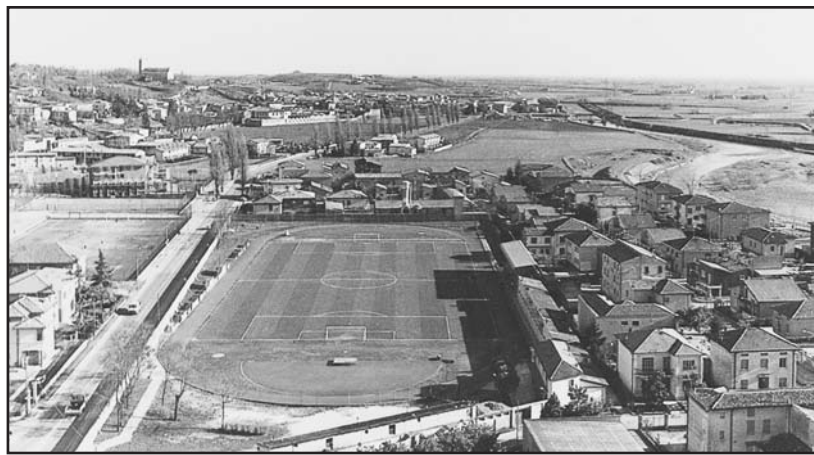
Lo stadio Romeo Menti, un patrimonio da salvaguardare.

I punti di penalizzazione, ben cinque, derivano dal fatto che non sono stati versati i contributi, previsti per legge, in tempo utile alla federazione, e questa situazione ha influito non poco sul risultato finale