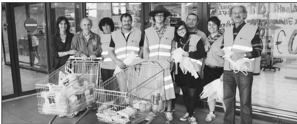
I volontari all'uscita del Supermercato Rossetto.