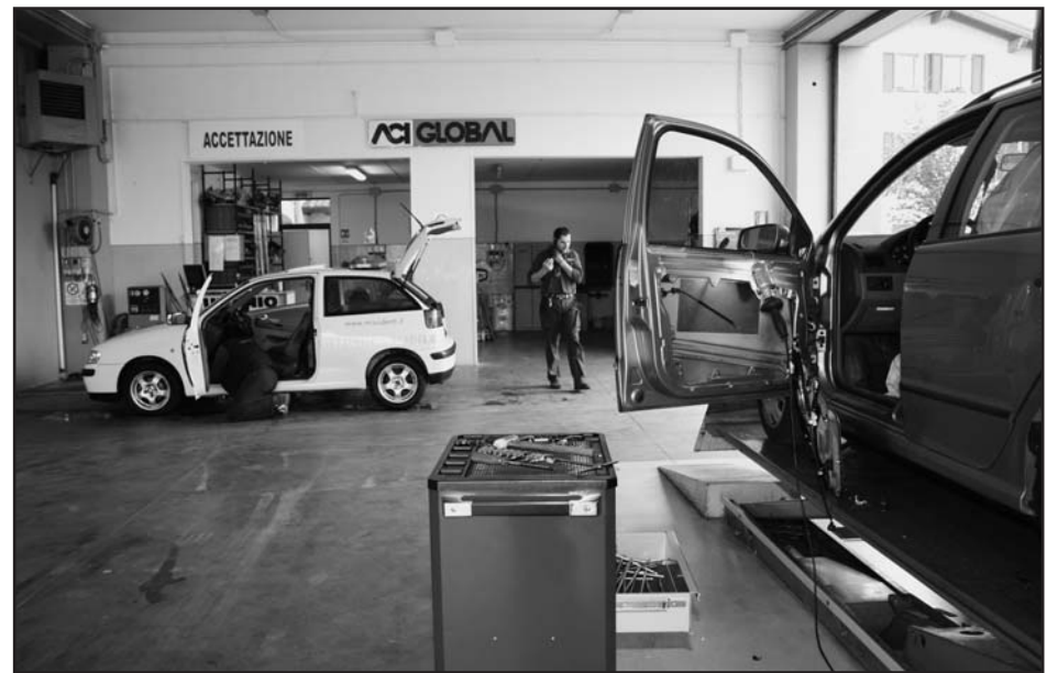
Elettrauto - Officina meccanica - Gommista - Diagnosi computerizzata - Ricarica condizionatori - Tagliando in giornata